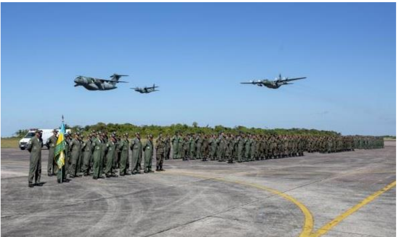
RAT – Reunião da Aviação de Transporte